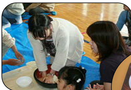
うどんを打って試食